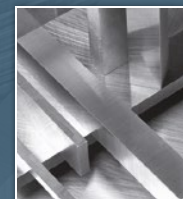
PRECIZ® - broušená ocel