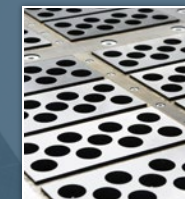
Formy na silikáty