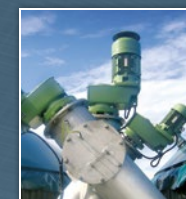
Dávkovací systémy - bioplyn